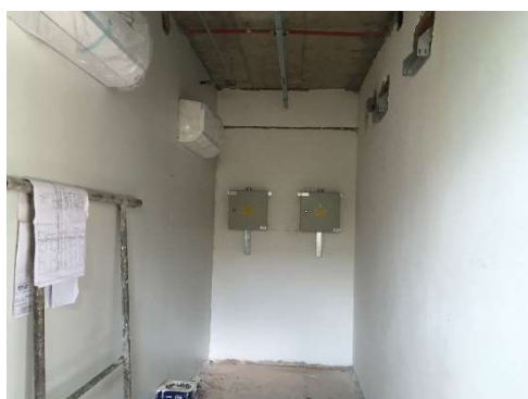
16 – Evaporadoras e quadros salas técnicas.