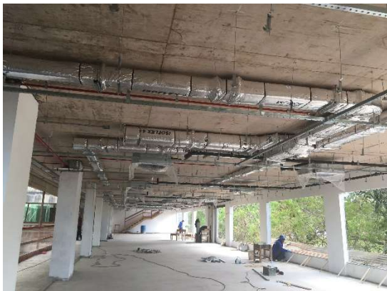
03 – Rede de dutos de ar condicionado.