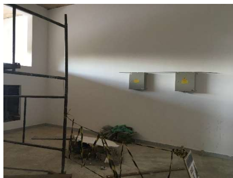
15 – Quadros casa de máquinas cobertura.