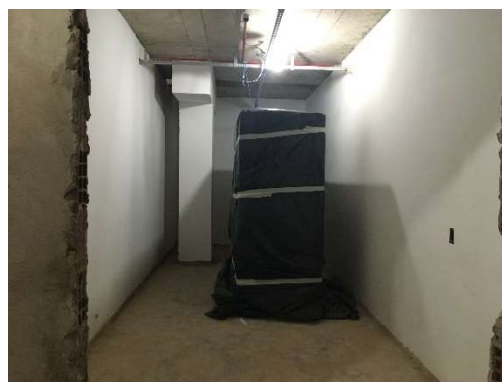
19 – Painel de medição alocado e protegido.