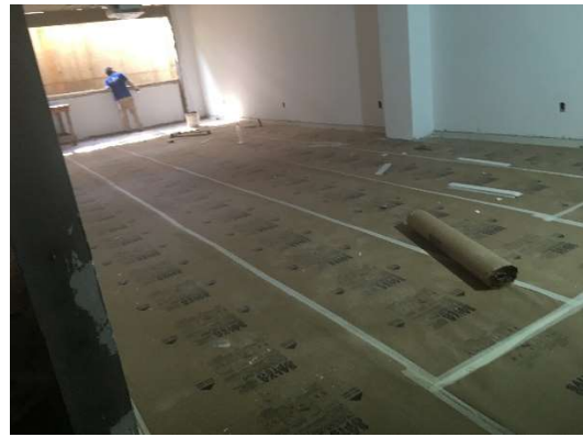
02 – Emassamento de paredes, semienterrado, proteção de piso.