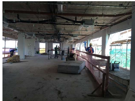
12 – Execução da rede de gás do ar condicionado.