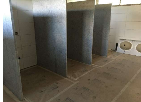
06 – Colocação de divisórias e bancadas nos banheiros.