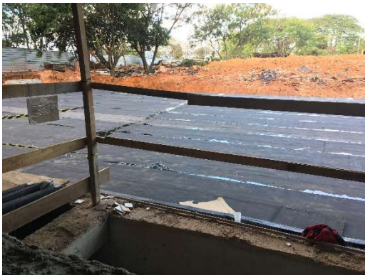
11 – Aplicação de manta área externa semienterrado.