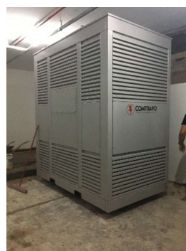
17 – Transformador.