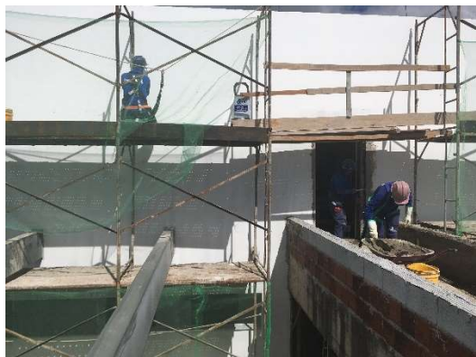
05 – Re-quadro de platibandas e cantos e emassamento de paredes.