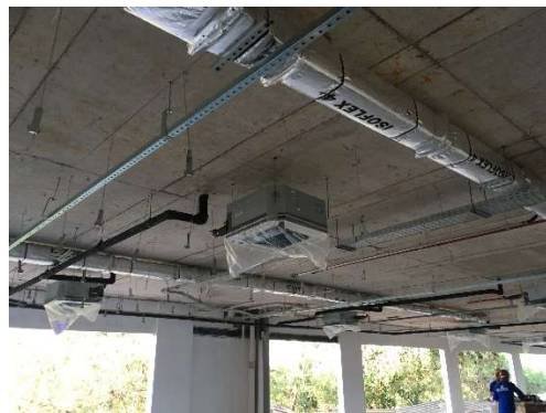
10 – Evaporadoras e rede de drenos.