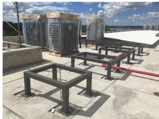
04 – Equipamentos de ar condicionado, condensadoras locadas na cobertura.