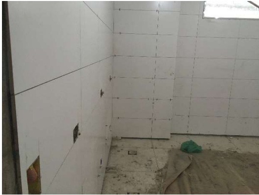
01 – Colocação de revestimento de porcelanato, piso e parede.