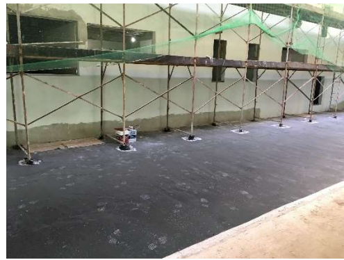
08 – Impermeabilização de áreas de jardim.