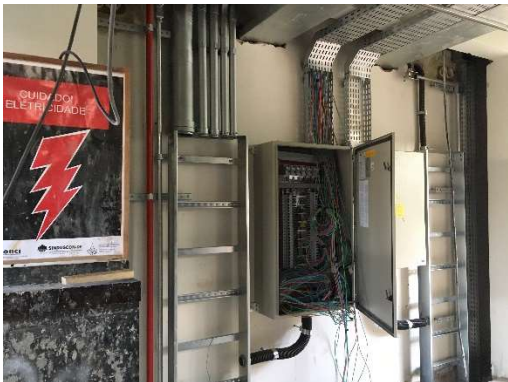
09 – Instalação de quadros.