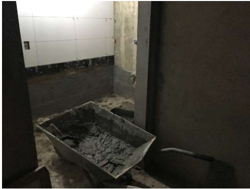
07 – Impermeabilização de áreas molhadas.