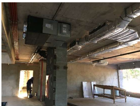
18 – Recuperador de ar.